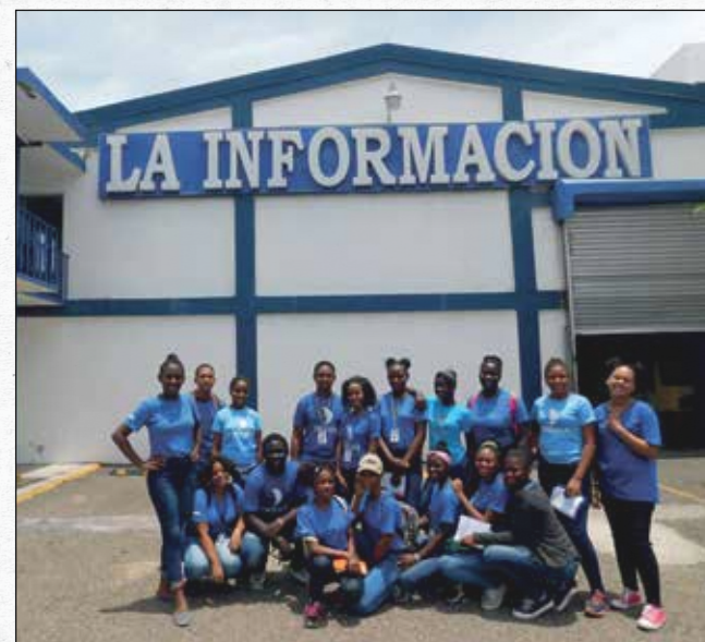
El equipo de MI MUNDO en su visita al periódico