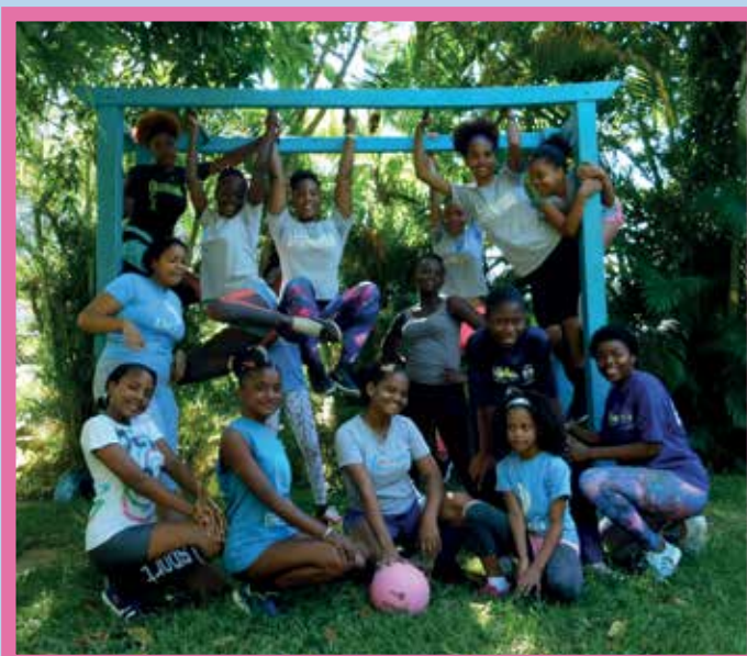
El DREAMTEAM durante un descanso de su entrenamiento

Ser una jugadora profesional, jugar en distintos países y compartir con las Reinas del Caribe, la selección nacional de volleyball.